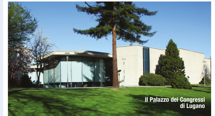
Il Palazzo dei Congressi di Lugano

16 - 17 - 18 settembre Centro Esposizioni Lugano www.mondo-bimbi.ch